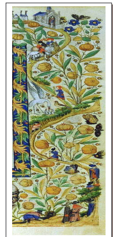
Heures de Marguerite d'Orléans